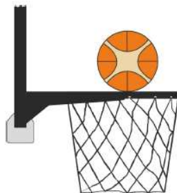
Figura 2 - Palla a contatto dell'anello

31-11 Precisazione - Un'interferenza è commessa dal difensore o dall'attaccante durante un tiro a canestro su azione allorché un giocatore tocca il canestro o il tabellone, mentre la palla è a contatto con l'anello ed ha ancora la possibilità di entrare a canestro.